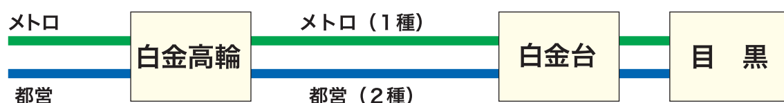
図1-b ※同じ事例があります

※綾瀬駅から西日暮里駅の区間の鉄道施設を、メトロがJRに貸してくれば、メトロが1種、JRが2種になり、西日暮里駅経由でも、JR運賃だけになって運賃が安くなります。